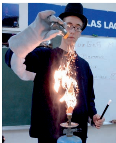
Figura 4. Combustión de limaduras de hierro.

Las cascadas de chispas doradas se pueden reproducir introduciendo limaduras de hierro en un salero y espolvoreándolas sobre una llama (figura 4). Las partículas de hierro solo alcanzan temperaturas del orden de 1.500 °C, frente a los 3.600 °C de la combustión del magnesio, que origina chispas mucho más brillantes y luminosas. Por esta razón antiguamente se utilizaban como flash o fuente de luz en fotografía.