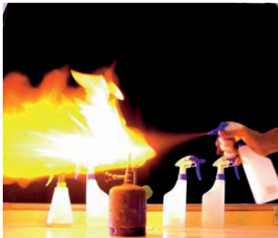
Figura 5. Efecto de color originado por una sal metálica

Según el catión que acompaña al cloruro, se obtienen diferentes colores: cobre (azul-verde), bario (verde), calcio (naranja), litio (rojo intenso), potasio (violeta), sodio (amarillo) y estroncio (rojo carmesí), alguno de los cuales se aprecia en la figura 5.