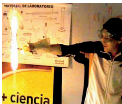
Figura 3. Combustión del carbón vegetal

• Se añade al tubo un pequeño trozo de carbón vegetal ( \text{C} + \text{O}_2 \rightarrow \text{CO}_2 ).