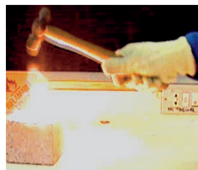
Figura 2. Combustión del fósforo

Debido al oxígeno suministrado por la descomposición del clorato ( 2\text{ KClO}_3 \rightarrow 2\text{ KCl} + 3\text{ O}_2 ) y al calor generado por el contacto con el martillo, el fósforo arde con facilidad ( \text{P}_4 + 5\text{ O}_2 \rightarrow 2\text{ P}_2\text{ O}_5 ), hasta el punto de explotar si golpeamos con más fuerza (figura 2).