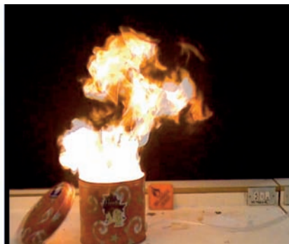
Figuras 9 y 10. Deflagración del licopodio

De inmediato, se producirá una deflagración: la tapa saltará por los aires por efecto de la presión y se generará una rápida combustión (figuras 9 y 10).