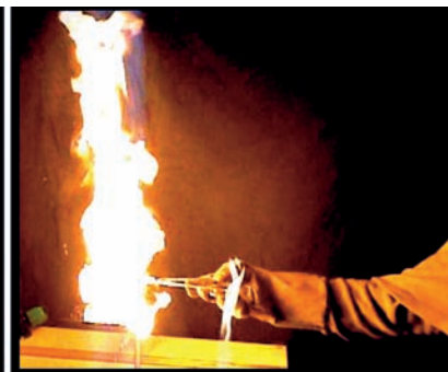
Figuras 7 y 8. Combustión de la nitrocelulosa

Esta espectacular y sencilla experiencia permite reflexionar sobre la ley de conservación de la masa, enunciada en 1774 por A. Lavoisier, ya que, en apariencia, la materia desaparece sin dejar ningún residuo. El químico francés marcó un hito en la historia de la química al demostrar que la aparente desaparición de la materia en el fuego era solo aparente: un componente invisible presente en el aire, el oxígeno, reaccionaba con los combustibles proporcionando calor y productos de la combustión