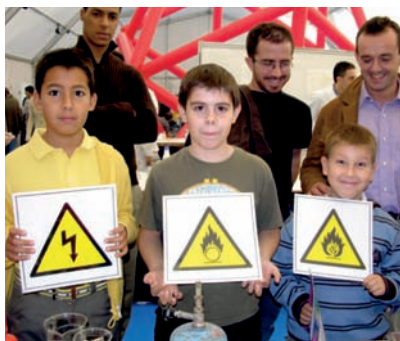
Figura 1. Triángulo del fuego